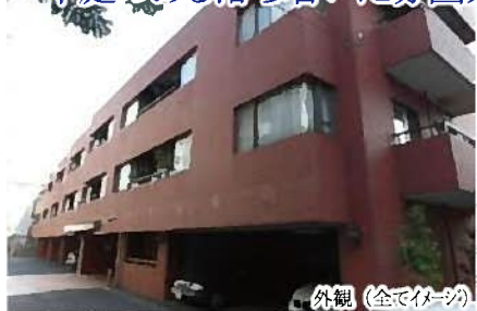
外観 (全てイメージ)