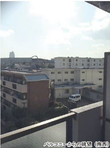
バルコニーからの眺望 (南西)