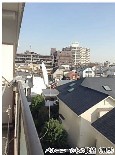
バルコニーからの眺望 (南東)