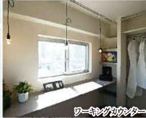
ワーキングデスク