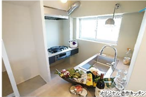
オリジナル造作キッチン