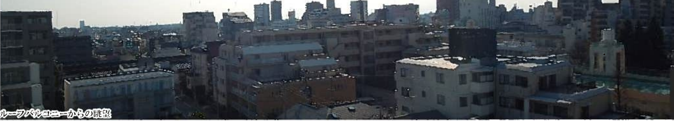
ルーフバルコニーからの眺望