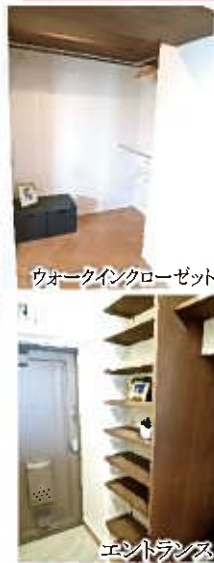
ウォークインクローゼット