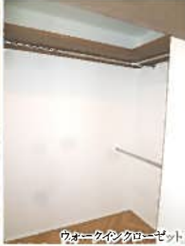
ウォークインクローゼット