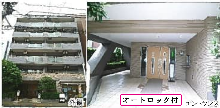
オートロック付 エントランス