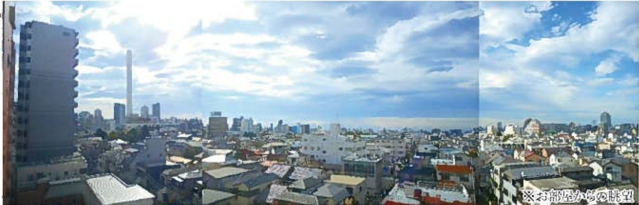
※お部屋からの眺望