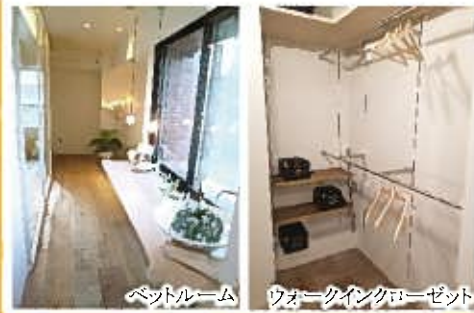
ベッドルーム ウォークインクローゼット