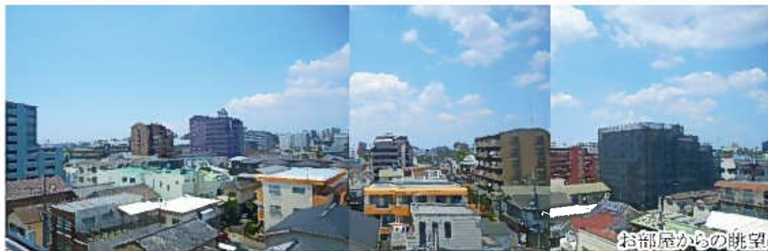
お部屋からの眺望