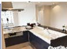
カウンター付きの キッチンネイビーを セレクト。