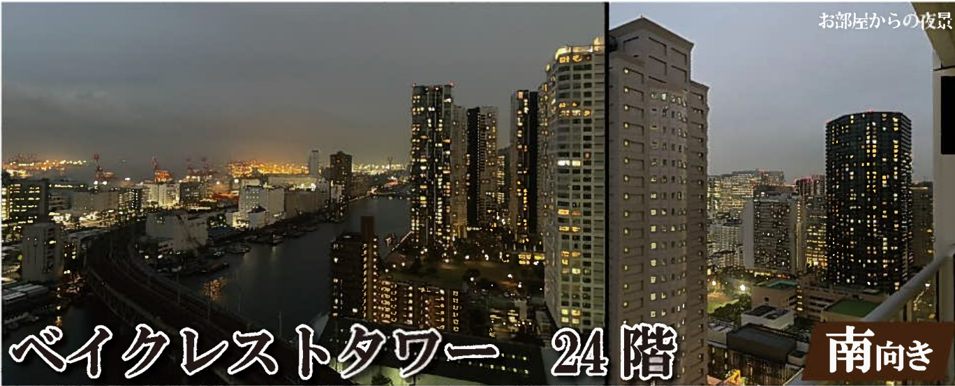
お部屋からの夜景