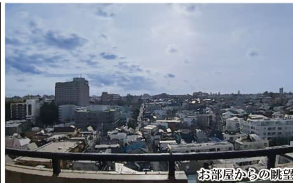
お部屋からの眺望