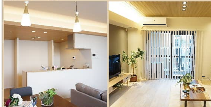
— 天井間接照明デザインイメージ写真 —