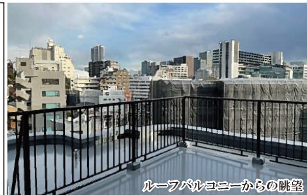
ルーフバルコニーからの眺望