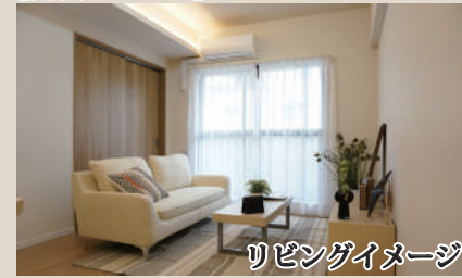
リビングイメージ