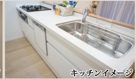
キッチンイメージ